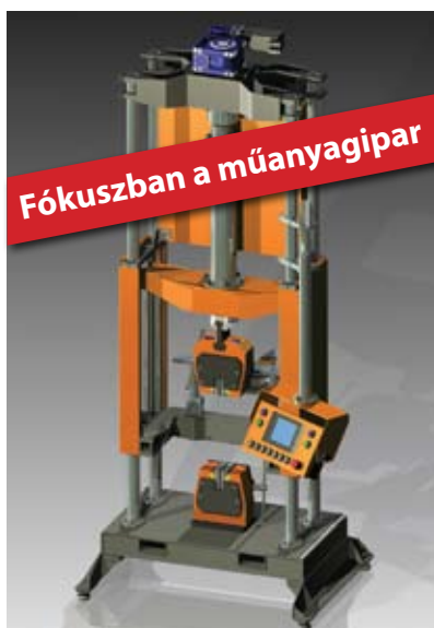
Műanyagipari anyagvizsgáló 28