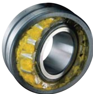
Kenőanyag vizsgálat 42