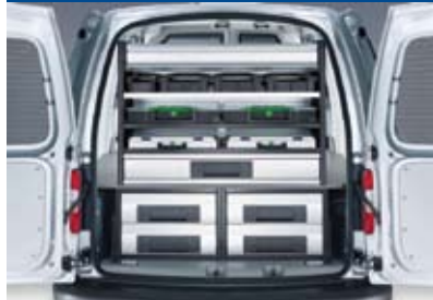
Funkcionális tárolás 31